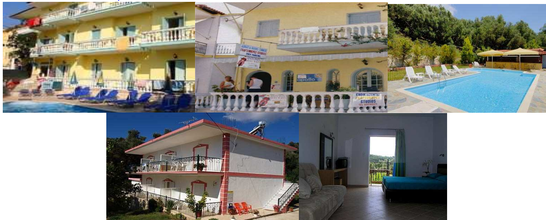
FOTO ESEMPLIFICATIVE DELLA SISTEMAZIONE

RESIDENCE "ROULETTE" DI CAT. 3*** SITUATI NELL' AREA DI PARGA/VALTOS BEACH O NELLE LORO IMMEDIATE VICINANZE, A BREVE DISTANZA ( MAX 1 KM. ) DALLA SPIAGGIA E DAL CASTELLO. TUTTE LE SISTEMAZIONI DISPONGONO DI ARREDI COMPLETI, CUCINA ATTREZZATA, ARIA CONDIZIONATA.