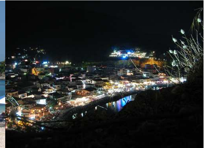
Il centro di Parga e la Spiaggia della località