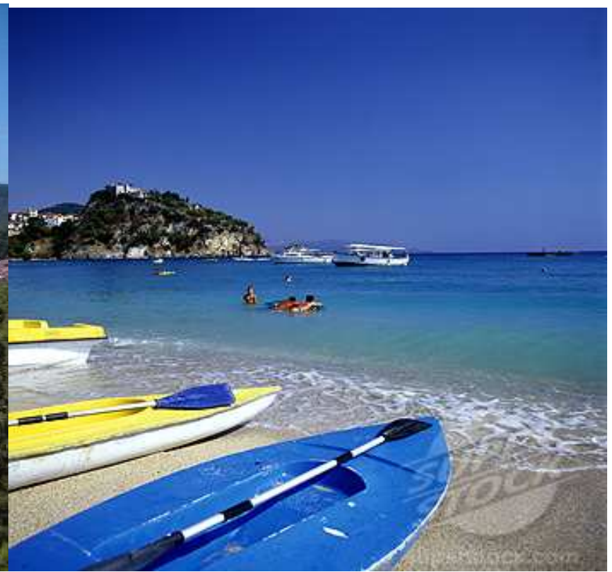
La Spiaggia di Valtos